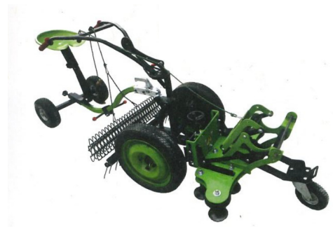
Equistab (basé sur StabNet 90P) avec sulky et kit finition