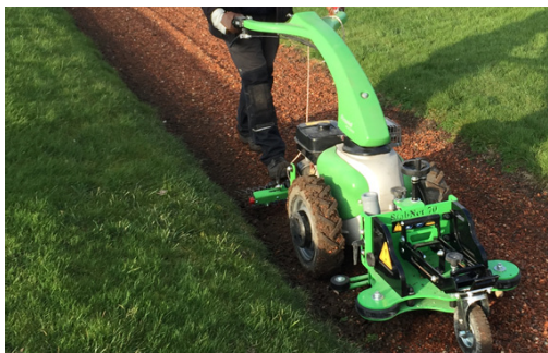
StabNet 70 sur Rapid Mondo