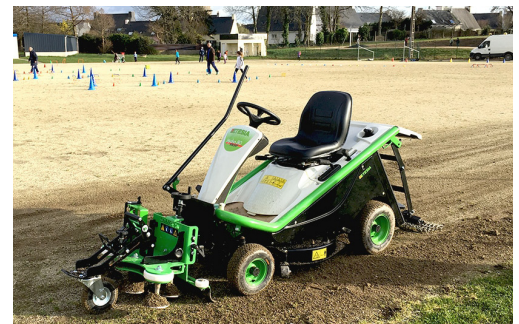
StabNet 70 sur Etesia H80