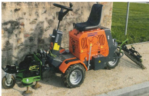
StabNet 70 sur Tichel